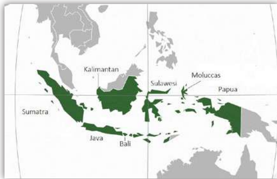
De grote eilanden van Indonesië omzoomd door Maleisië en Thailand in het noorden en Australië in het zuiden.

Dit artikel "De oorsprong van Islam in Indonesië" is geschreven om antwoord te geven op deze vragen. Het eerste deel beschrijft het eerste contact tussen Islam en het Indonesisch volk en hoe Islam zich verspreidde op het eiland Sumatra als gevolg van dit eerste contact. Het tweede deel gaat over hoe Islam zich verspreidde naar de andere grote Indonesische eilanden zoals, Java, de Molukken, Sulawesi en Kalimantan. Het derde en laatste deel is een analyse van welke lessen getrokken kunnen worden omtrent de verspreiding van Islam in Indonesië.